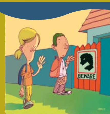
Родителям требуется помощь в борьбе со стрессом.