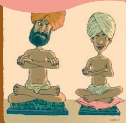
Детям нужно больше защиты, а не меньше.