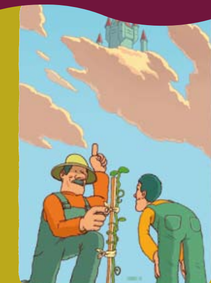
Дети нуждаются в руководстве, чтобы в максимальной степени развить свой потенциал.