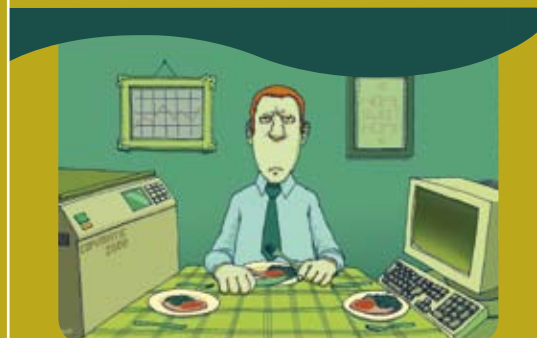
Позитивное родительство означает равновесие между семейной и профессиональной жизнью.