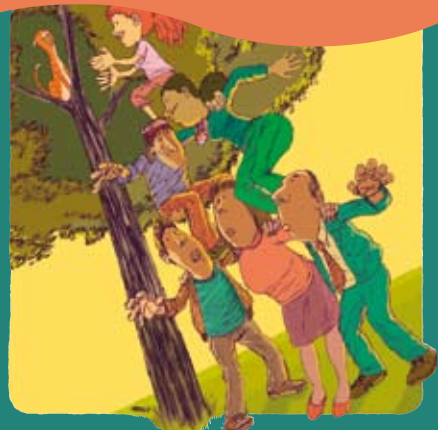
Права детей позволяют семьям расти.

Под позитивным родительством понимается такое поведение родителей, когда уважаются высшие интересы детей и их права, как они изложены в Конвенции ООН о правах ребенка. При этом в данной Конвенции учитываются также потребности и возможности родителей. Позитивный родитель заботится, обучает, направляет и признает ребенка как полноправную личность. Позитивное родительство не означает воспитание на принципах вседозволенности: оно устанавливает такие границы, которые нужны детям для того, чтобы помочь им в полной мере развить свой потенциал. Позитивное родительство уважает права ребенка и воспитывает их в окружении, где нет места насилию.