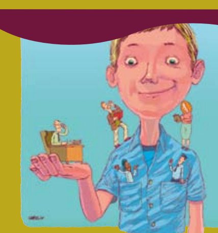
Права детей касаются всех нас.